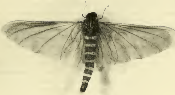
Abb. 3: Oligoneuriella rhenana (Imhoff, 1852). Männchen Dorsalansicht.

haut bleibt auf dem imaginalen Flügeln erhalten, da die Tiere ihre Imaginalhäutung in der Luft während des Fluges vollziehen, – Schwierigkeiten erneut von einem flachen Substrat wieder aufzufliegen. Beobachtungen ergaben, daß diese Tiere, ♂♂ und ♀♀, durch Aufbiegung des stark luftgefüllten Hinterleibes versuchten, aus dem Licht ins Dunkel zu kommen. Die Beine schienen dabei keinerlei unterstützende Bewegungen machen zu können. Offensichtlich werden diese ausschließlich bei der Flugpaarung eingesetzt.